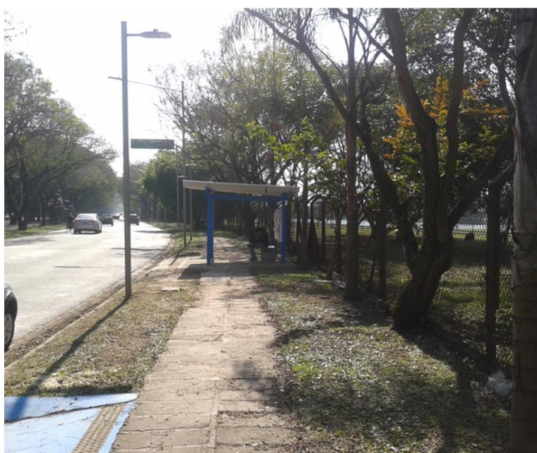
Imagem 03: Condição anterior do passeio na Av. Mello Moraes