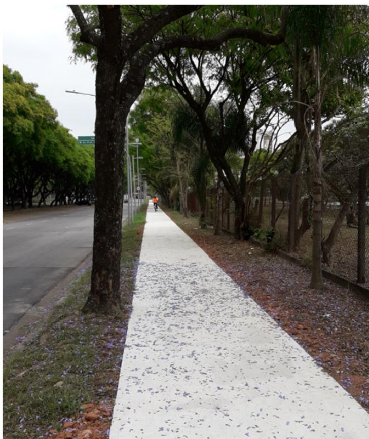
Imagem 04: Segmento do novo passeio reformado na Av. Mello Moraes