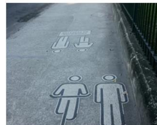
Imagem 02: ciclovias em Brasília, com pintura similar a que será implantada no passeio / ciclovias compartilhadas na Av. Mello Moraes