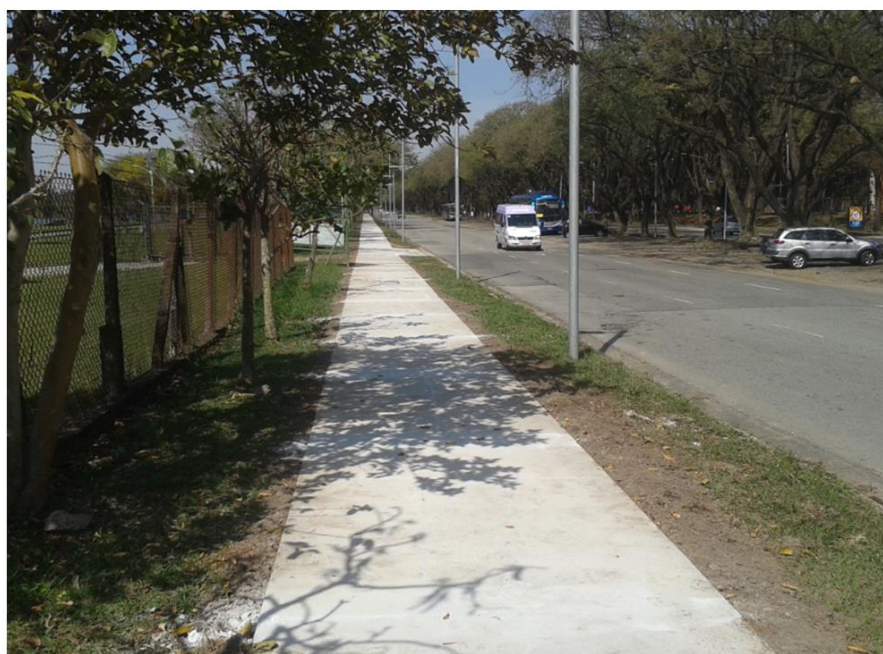
Imagem 05: Segmento reformado para ciclovia compartilhada na Av. Mello Moraes